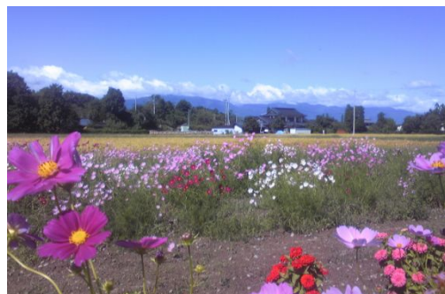
↑写真③ この写真の左部分にある樹林帯が丘陵の北端で、ここから南へ展開している。