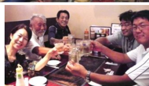
←写真④ 前夜の“作戦会議”。「熱中症予防ドリンク」をしっかり補給しました。