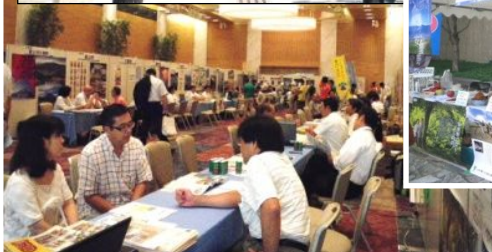
↑写真② 当NPOの室内ブース。