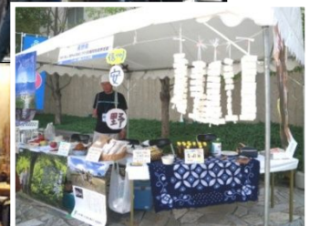
↑写真③ 当NPOの屋外ブース。