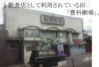
↓飲食店として利用されている旧「豊科劇場」。

ぐ花柳界の余韻を今に伝える「うろたえ橋」跡や「豊科劇場」跡など、近世から近現代に至る歴史のダイナミズムを味わえるルートになるでしょう。只今鋭意準備中！ご期待ください。