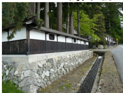
近世の趣を伝える山口家。特に庭園は必見。

、旧大庄屋の山口家、そしてドラマ「おひさま」のロケ地など、自然、文化・歴史からエンタメまで思いがけず変化に富んだコースです。只今鋭意準備中！ご期待ください。