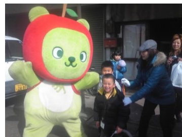
昨年のあめ市ウォークラリーの様子。

第6回～第10回分のふるさとウォッチングをまとめた「ふるさとウォッチングマップ・第2集」が完成しました。各地区の見どころをルート地図、写真、イラスト付でわかりやくまとめたオールカラーの小冊子です。平成23年度県元気づくり支援金を活用して作成したため非売品となっていますが、平成24年度「ふるさとパートナー」登録更新者には無料で進呈いたします。現在の登録者も毎年3月に更新手続きが必要ですので、新年度もご継続よろしくお願いたします。