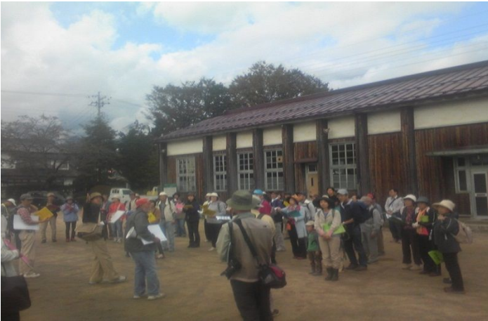
起着場所は“近代建築遺産”ともいべき新屋公民館。

次回の第14回は3月25日（日）、三郷・一日市場地区での開催を予定しています。内容についてはたまたま鋭意計画中。詳しくは次号通信でご案内しますのでお楽しみに！