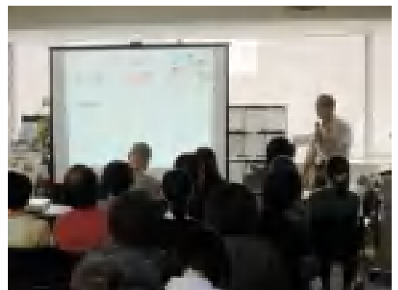
昨年のセミナーの様子。

詳細は別添のちらし、および http://www.furusatokaiki.net/event/9816/ をご覧ください。