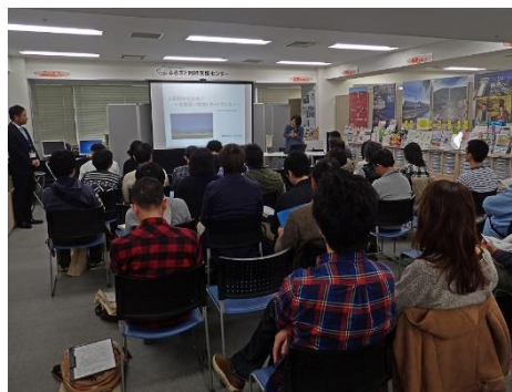
昨年11月のセミナーの様子

事務局：安曇野市役所)の主催となりますが、引き続き安曇野ふるさとづくり応援団も全面的に協力していますので、ぜひ多くの方のご参加をお待ちしています。