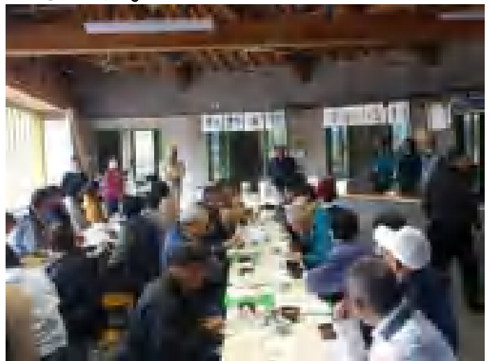
ウォッチング終了後、ぬかくどおにぎりを食す。施設管理者のご厚 意で、急ぎに開放していただいた「せせらぎ」の建物内で。悪天候 だった分味わいも格別?

過去に実施したウォッチングの縮小版「ふるさとさんぽ」 の第4回から7回目までを、昨年10月から11月にかけて 実施しました。穂高保高宿、穂高小岩岳、豊科熊倉、三 郷二木の4地区で、いずれも20名程度の小グループにて 、じっくりウォッチング。今年も引き続き行う予定です。