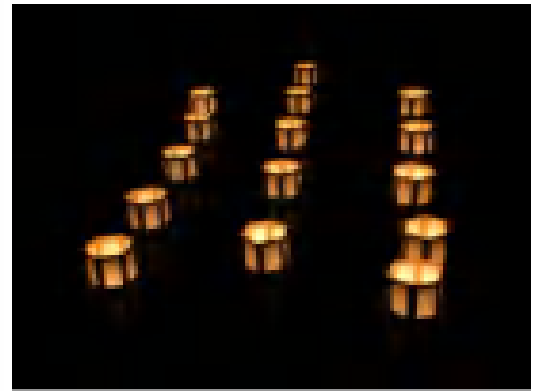
矢原堰の灯籠流しの様子。

クラリーに加え、ダンボール灯 籠作りやひとちずワークショップ、碌山美術館建設秘話や 火の見櫓講座等、ちょっと変 わった魅力ある講座がいっぱ い。また、同時開催の穂 高あめ市も楽しいイベントが盛 り沢山なので、是非ご家族や 友人を誘ってご参加ください。 尚、カレッジの申込受付は1月 25日スタートです。詳しくは別 紙案内または公式サイト( azumino-college.net)をご覧く ださい。